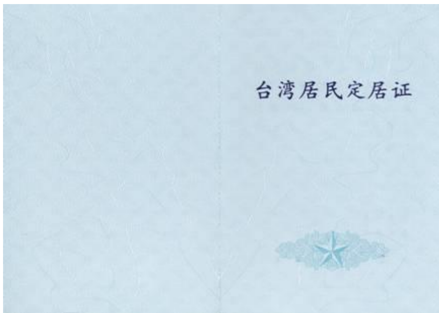
台湾居民定居证（正面）